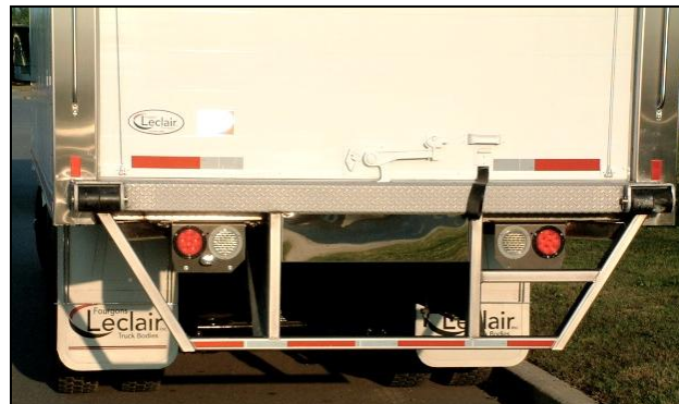
Pare-chocs en acier inoxydable