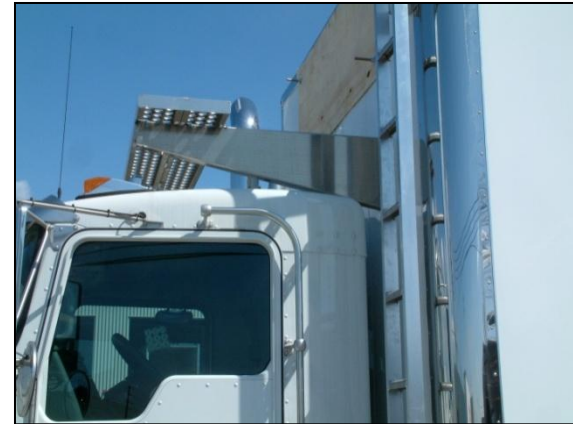
Passerelle et échelle en aluminium