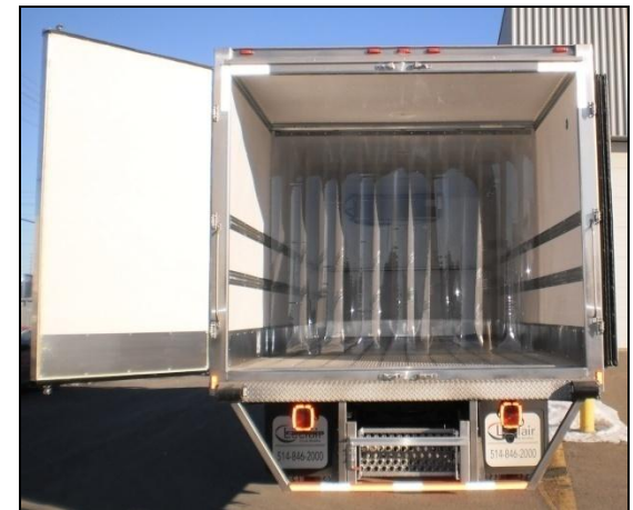
2 portes arrières pleine grandeur